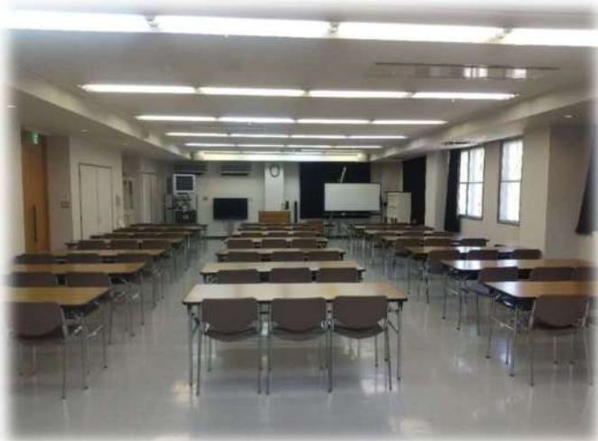
集会室 A 80人