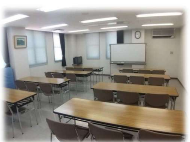
集会室 B 40人13