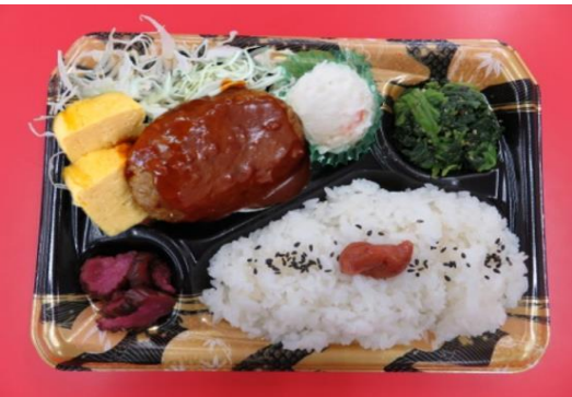
代替ハンバーグ弁当